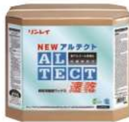
18L 1,800m 2 /箱

(注) 試験条件: 室温20℃、湿度50% (25℃) での試験。100%に乾燥するまでの時間を測定。1-40分後に手拭き紙を敷いた床面にワックスを塗布し、乾燥後に20分経過後 (25℃) の乾燥率を測定し、100%に乾燥するまでの時間を測定。1-40分後にワックスを塗布した床面に手拭き紙を敷いた。