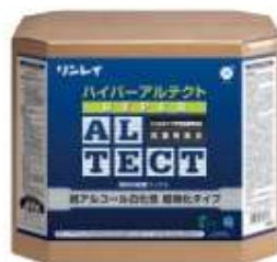
18L 1,800m 2 /箱