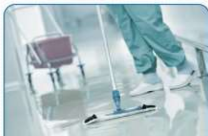
清潔であること 清掃が行き届いている状態