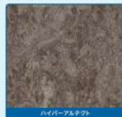
ハイバーアルテクト