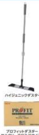
ハイジェニックダスター プロフィットダスター サンタリークロス (Sサイズ)