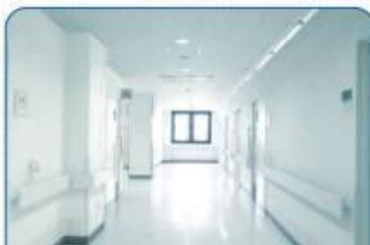
衛生的であること 感染対策が機能している状態