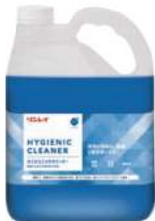
4L 3本入 / 1ケース