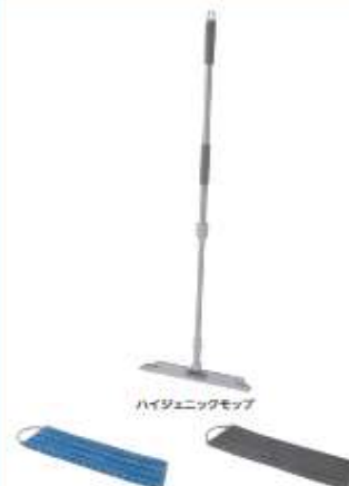
ハイジェニックモップ ハイジェニックモップラッグHG (ハイグレードタイプ) ハイジェニックモップラッグST (スタンダードタイプ)