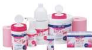
環境除菌・洗浄剤

*米国ではRelayOn® Multi-Purpose Disinfectant Cleaner等の製品名で登録されています。