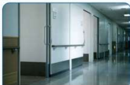
静粛であること 作業時の不快な音が抑制されている状態

どんなに優れた消毒剤や除菌剤でも、埃や汚れが残った状態や誤った作業手順では本来の効果は得られません。感染対策面でも、適切な清掃が非常に重要となります。