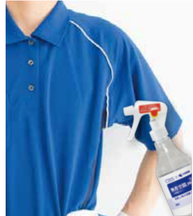
衣類・ユニホームに