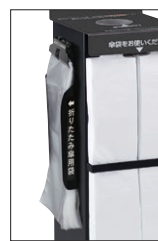
折りたたみ傘用傘袋ホルダー ブラック▶P.135