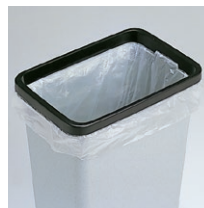
袋止め付ボックス