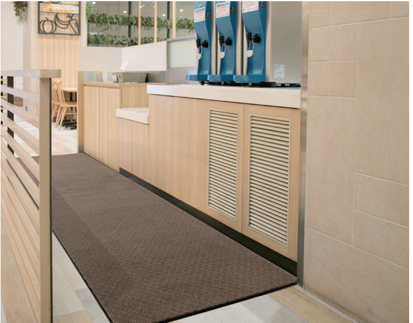
雨天用マット ニューテラレイン(ブラウン)