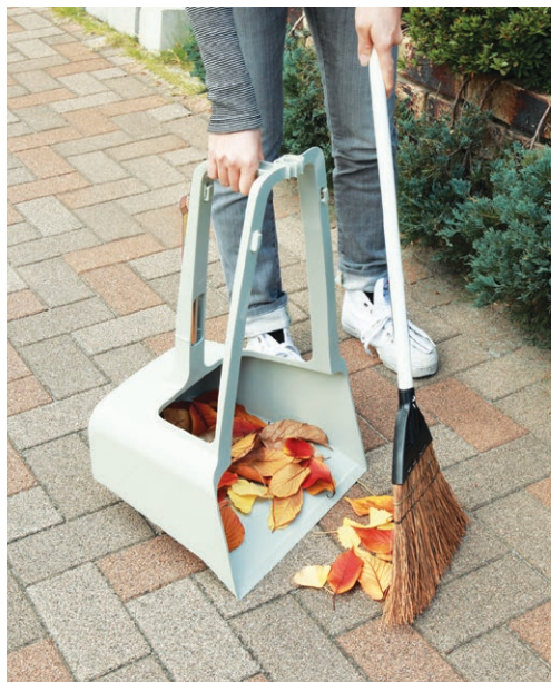
MMエコプラミツ手チリトリ+MMテーロンホーキ(P449)