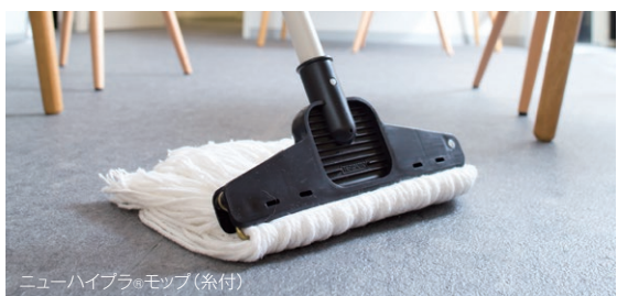
ニューハイブラ®モップ(糸付)