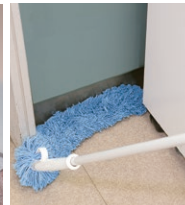
床面やOA機器との隙間に